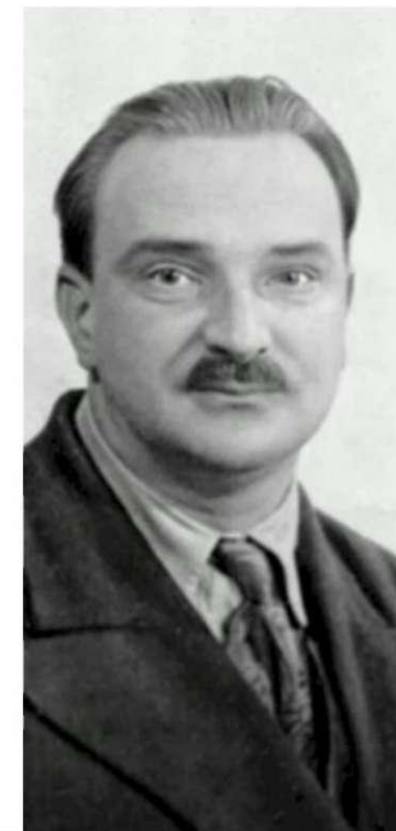
ВИТАЛИЙ ВАЛЕНТИНОВИЧ БИАНКИ (1894 – 1959)